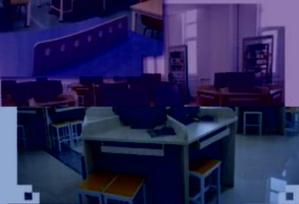
一体化课程教学设计 综合实训室