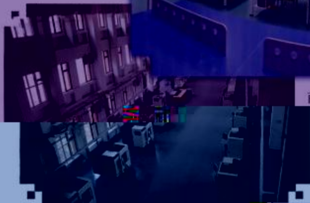
DMG 数控技术 训练场所